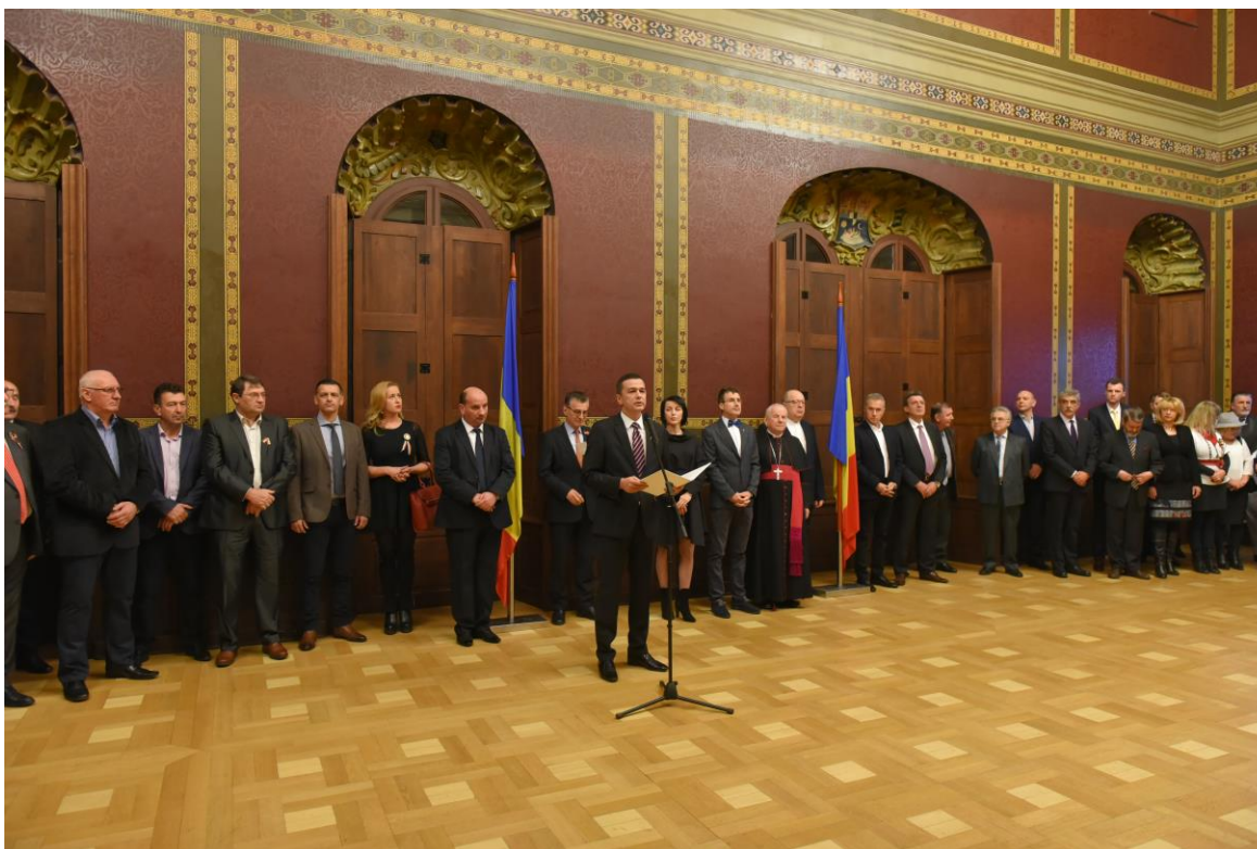
Recepția oficială de Ziua Națională a României – 1 Decembrie 2016

În ceea ce privește activitățile de protocol pe parcursul anului 2016, Serviciul Relații Externe a organizat primiriile delegațiilor oficiale la CJT, asigurând desfășurarea acestor primiri conform uzanțelor protocolare în cooperare cu Protocolul Național și Îndrumătorul de Protocol.