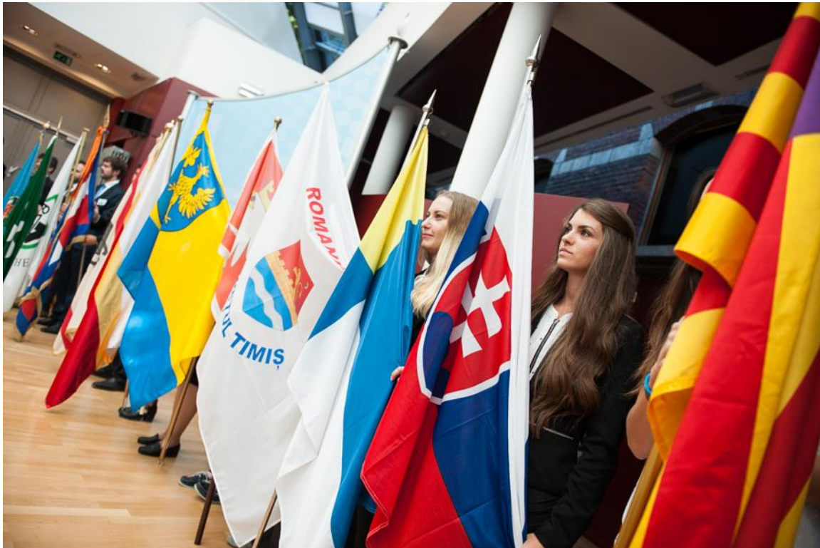
Drapelele regiunilor semnatare a Declarației comune

regiuni, orașe, municipalități din 22 de state europene (71,5% din populația UE) și 5 organizații interregionale. Cartea declarațiilor a fost înmănată comisarului european pentru politică regională și urbană, dna Corina Crețu, președintelui CoR, dl Markku Markkula, președintelui Comisiei REGI a Parlamentului European, dna Iskra Mihaylova, și reprezentantului Președinției slovace a UE, dl Peter Javorcik. Principalele idei-cheie ale declarației fac referire la faptul că: politica de coeziune trebuie să fie o politică pentru toate regiunile Europei și după 2020, este necesar ca bugetul comunitar, care dispune de suficiente resurse, să prevadă fonduri suficiente pentru toți, iar flexibilitatea și simplificarea să fie criterii obligatorii care să susțină o abordare bazată pe realitățile regionale.