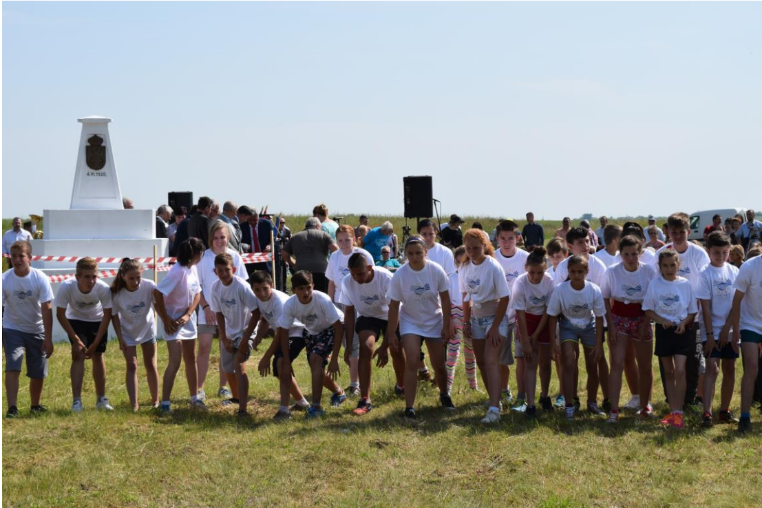
Start la crosul DKMT la Triplex Confinium

În data de 28 mai 2016 a avut loc și tradiționala festivitate de deschidere a granițelor între România, Ungaria și Serbia la Triplex Confinium .